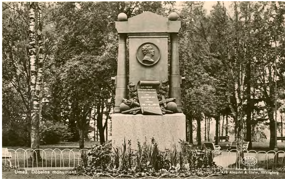
Vykort 1940-tal. Monumentet uppfördes i gjutjärn och granit.

Alla konstruktioner och material bryts ner med tiden, särskilt när de utsätts för väder och vind. Därför är det viktigt med ett korrekt underhåll som kan hindra eller bromsa den nedbrytningen. På grund av det skick som Döbelns monument nu befinner sig vill Föreningen Byggnadskultur återigen uppmärksamma Umeå kommun på detta.